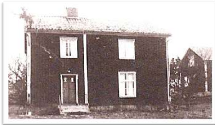
Hällingsfalls skola med småskolehuset till höger

1846 togs Hannäs första byggda skolhus i bruk i Hällingsfall. Ett tvåvåningshus med en skolsal på nedervåningen och lärarbostad på övervåningen. Undervisningen pågick under vårterminen medan den under höstterminen hölls i Fredriksberg. 1878 anställdes en fast lärare.