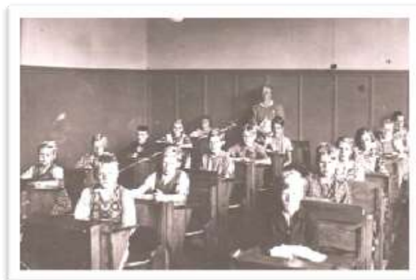
... och interiör i klassrum

1932 byggdes Rumhults skola, med ett klassrum och en lärarbostad. Skolan startade höstterminen 1932 och lades ned efter höstterminen 1954.