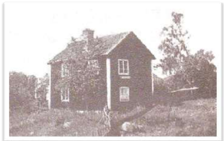
Fredriksbergs första skolhus