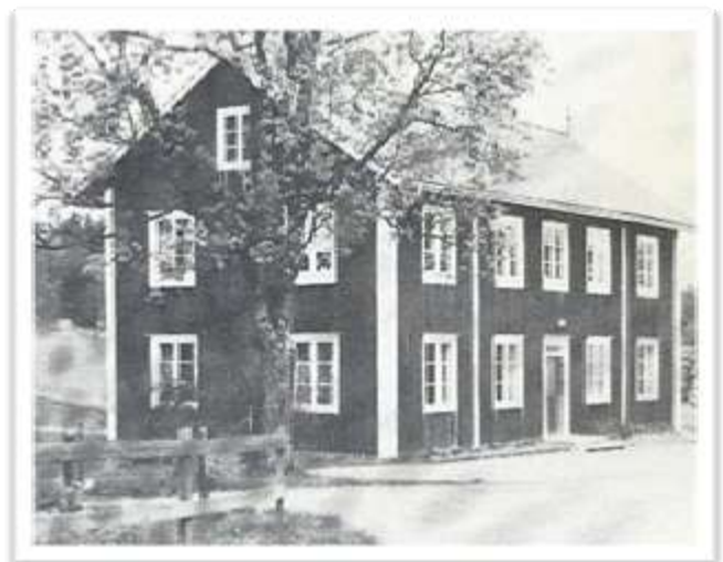
Sockenhuset med småskola

Småskolan i Fredriksberg flyttades till Sockenhuset 1889, och tillbaka till Fredrikberg 1957.