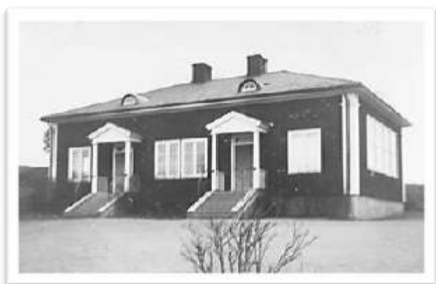
Rumhults skola ...