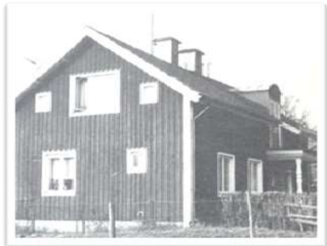
Dagsbergs första skolhus

1888 uppfördes Sockenhuset av överblivet virke från kyrkbygget. Det var ett kombinerat småskole-sockenhus och församlingshem.