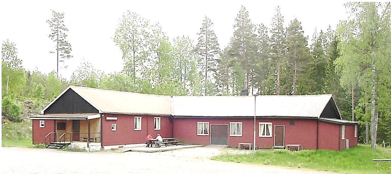
Rumma Folkets Hus 2001.

Rumma Folkets Hus byggdes 1948. Från början köptes en militärbarack, som senare byggdes till. Där var både dans, möten och även biograf. Det fanns även en dansbana utanför.