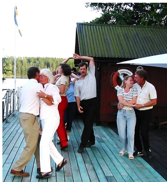
Dans på bryggan vid Amandas öga 2002.