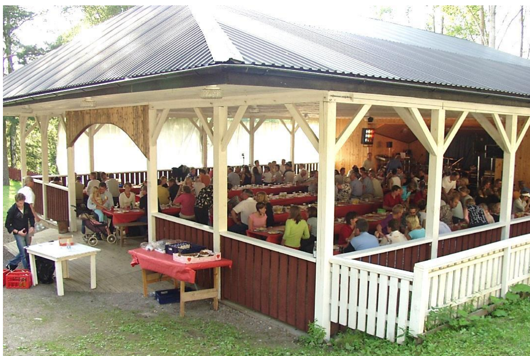
Sillbord på Kvarnviks Festplats 2004.