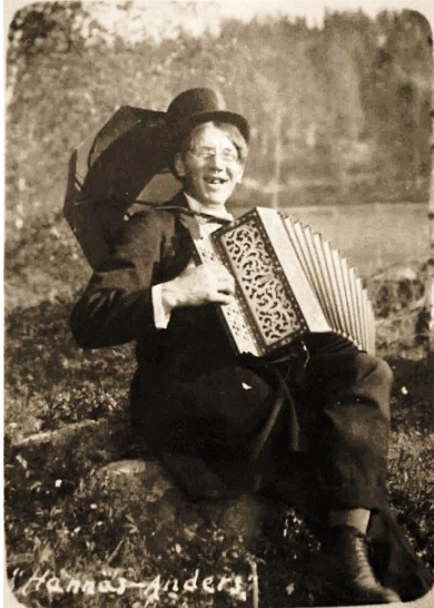
"Hannäs-Anders". HBF nr 19

Idag kan man se tre eller fyra stenar som bildar en fyrkant, vilka var grunden till dansbanan. Skog bestående av gran och björk växer i och omkring området.