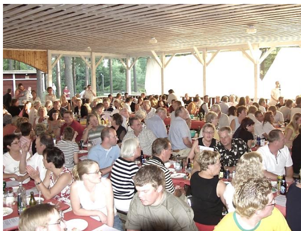
Dukat till Sillbord på dansgolvet på Kvarnviks Festplats. Foto Erik Höjer 2004. HBF nr 1950.

Familjedagar och andra samkväm anordnas på Festplatsen. Dessutom hålls årligen Holmbo marknad där.