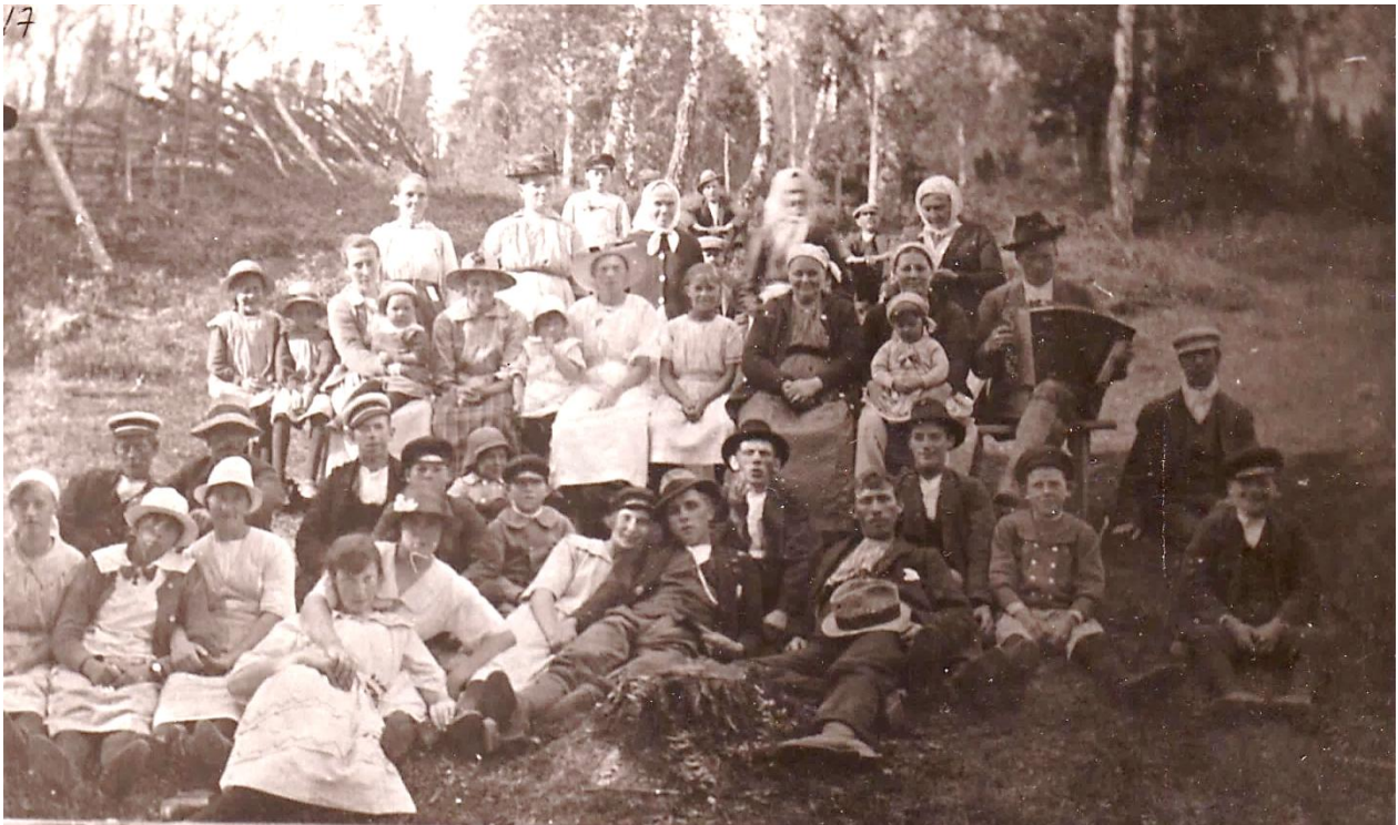
Dansbanan vid Kattpussen i Rumhult ~1921. HBF nr 2095. Namnen i Rumhults fotopärm sid 11a.