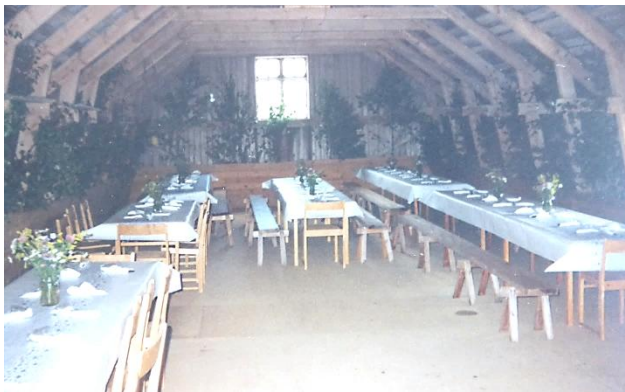
Dukat för 120–150 gäster på magasinet i Giltebo 2001. HBF nr 2856.