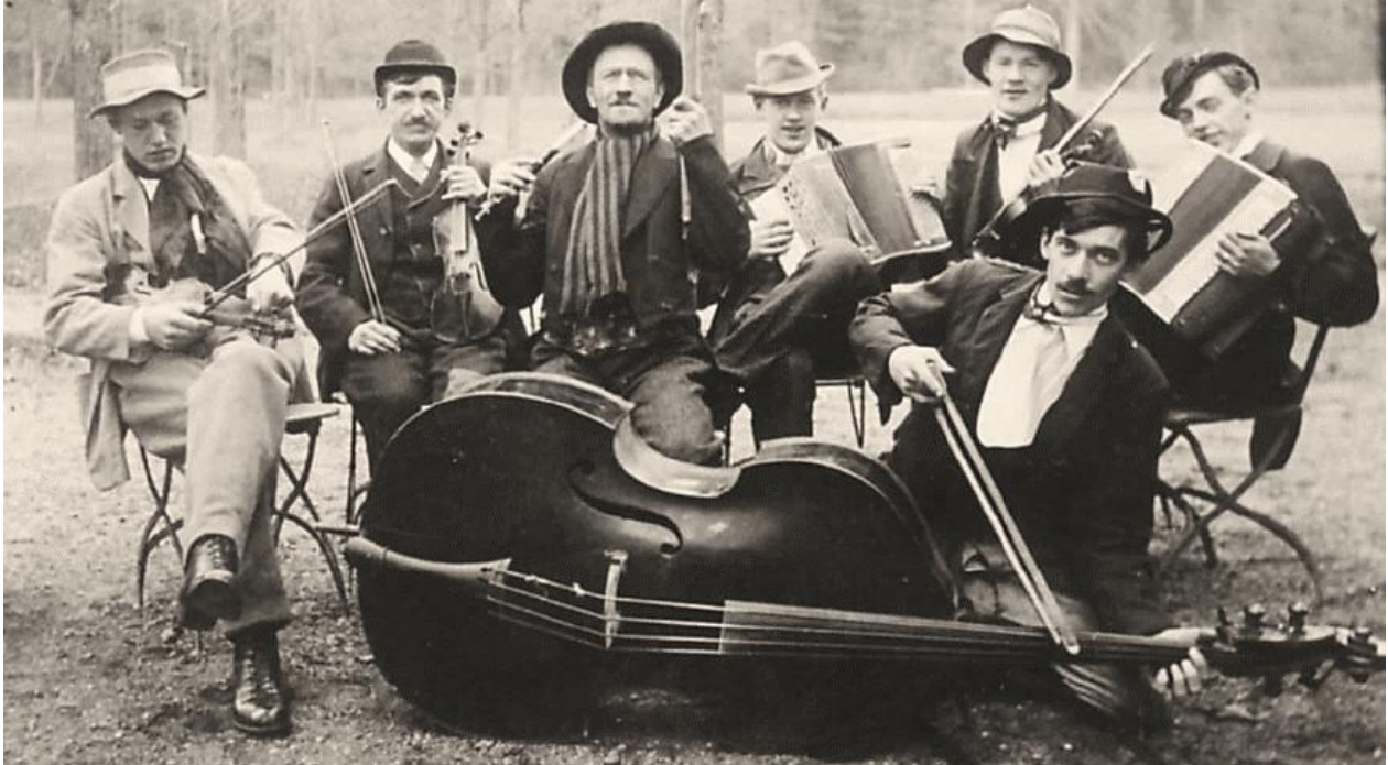
Luffarkapellet från Gusum som 1923 spelade på en fest i Hällingsfall. HBF nr 2789.

Mellan Hällingsfall och Lilla Viggedala, öster om vägen, fanns en dansbana redan på 1920-talet. Sjukvårskassan höll sin årliga sommarfest där, och den drog mycket folk trots få attraktioner.