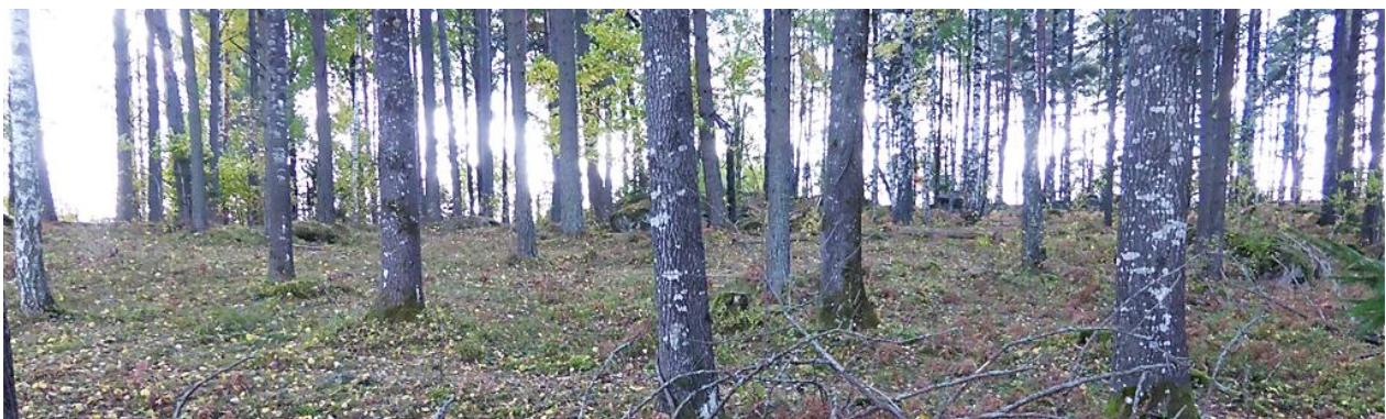
Dansbanan låg uppe på åsen. Dansbanekullen i Hällingsfall 2022.