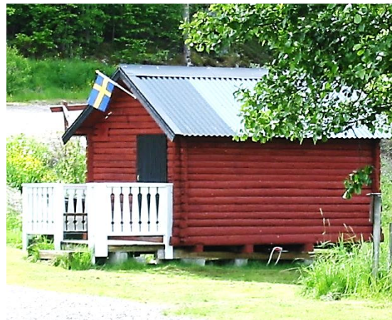
Sjöboda används som omklädningsrum vid badstranden vid Amandas öga.

Sjöboda skänktes av familjen Fredriksson i Falla till Vindommens Småbåtssällskap 1991, flyttades till andra sidan av Fallaviken, och används som omklädningsrum vid badstranden vid Amandas Öga.