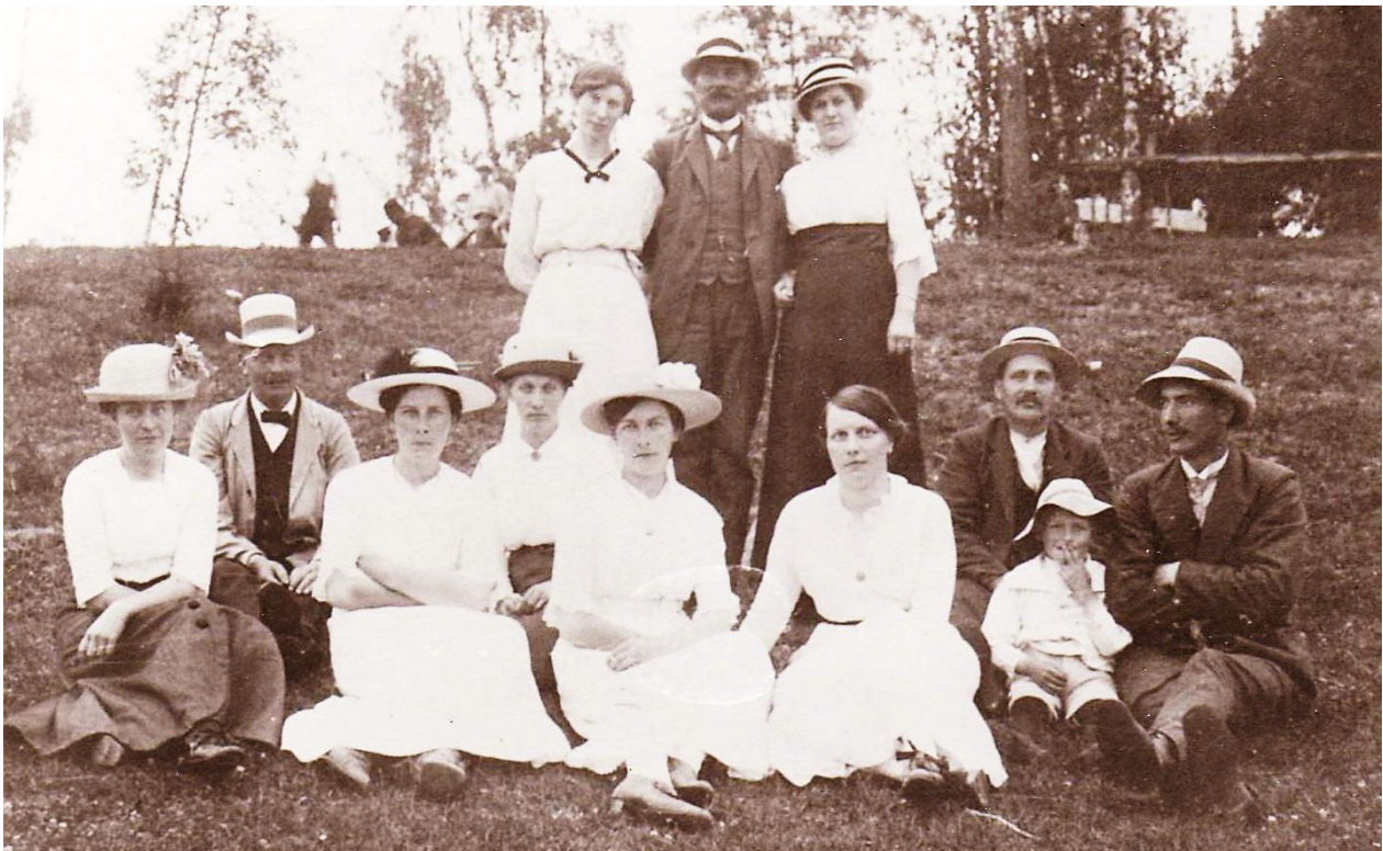
Dansbanekullen i Hällingsfall. HBF nr 2152.