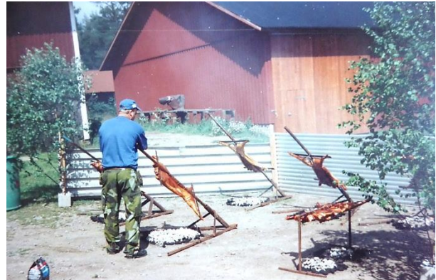
Grisarna grillades under sex-sju timmar. HBF nr 2860.