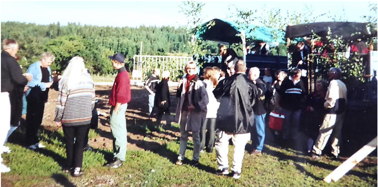
Gästerna kom från Hägerstad-Hannäs och Gärdsnäs-Hällingsfall till grisfesterna i Giltebo. HBF nr 2858.