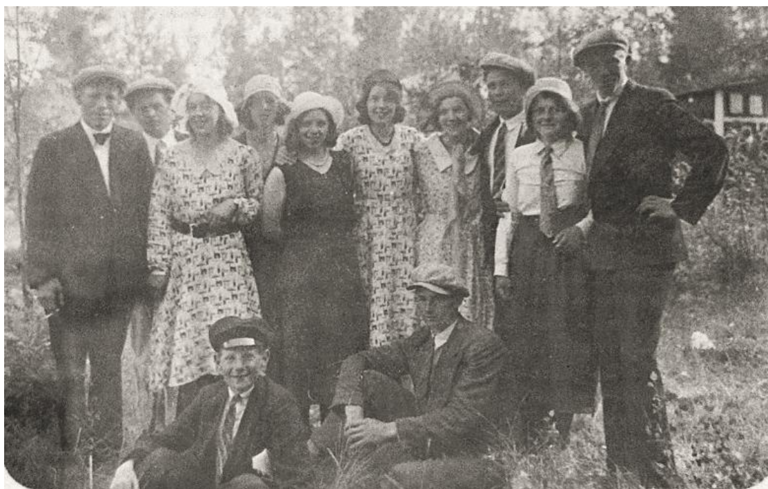
Vid dansbanan i Rumma i mitten på 1930-talet.