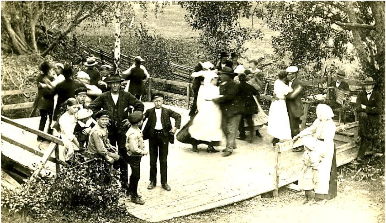
Dansbanan vid Jonsved 6 mellan Rumhult och Gärdsnäs ~1935. HBF nr 1495.

Ett par hundra meter efter Frälsegården i Rumhult i riktning mot Gärdsnäs, på höger sida om vägen, fanns en dansbana som kallades Kattpussen. Ungdomarna i Rumhult och Gärdsnäs byggde en gemensam dansbana vid Jonsved 1930. Dansbanorna vid Kattpussen och Jonsved låg väldigt nära varandra, så troligen fanns de inte samtidigt, utan vid olika tidpunkter. Dansbanan vid Jonsved var förmodligen den sista dansbanan i den norra roten.