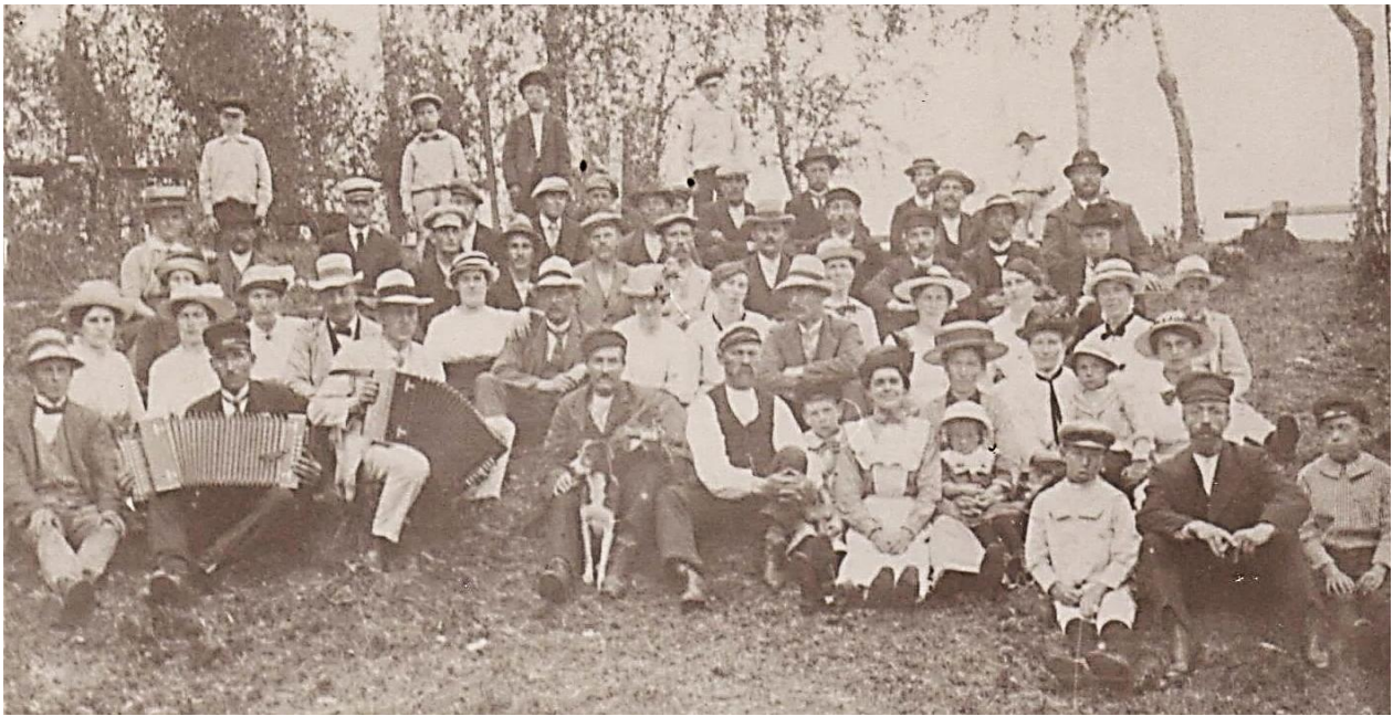
Dansbanekullen i Hällingsfall. HBF nr 2151.