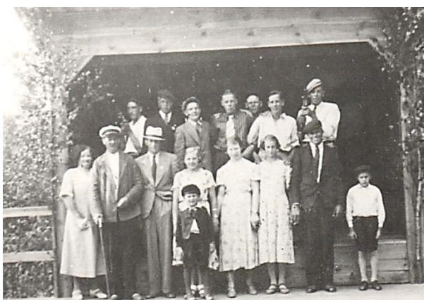
SLU:s invigning av den första dansbanan på Kvarnviks Festplats 1937.

1943 bildades en Festplatsförening som bestod av tre representanter från vardera SLU-avdelningen, Skytteföreningen och Idrottsföreningen. Nu drivs Festplatsen av Hannäs IF som ansvarar för drift och underhåll. 1993 renoverades Festplatsen och man byggde tak över dansbanan. Många kända dansband har spelat där som Rose-Maries 9 , Ken Kåbes 10 och Titanix 11 .