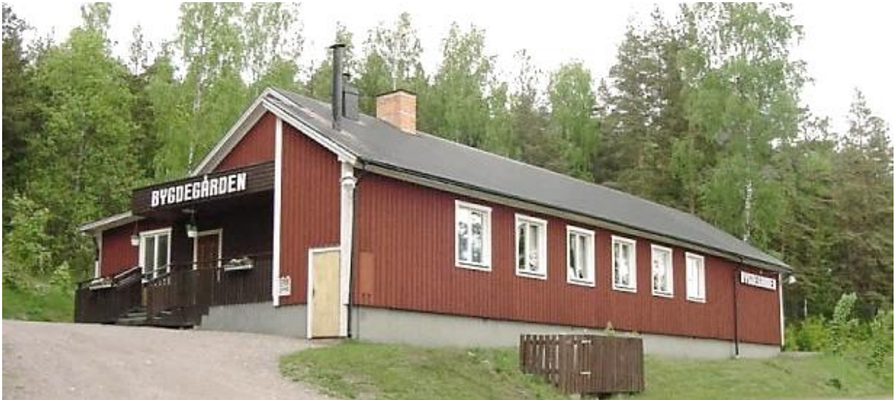
Kvarnvik-Hannäs Bygdegård 2003.

Bygdegården byggdes till under 2020-21 och fick ett helt nytt kök för att kunna möta de behov av faciliteter som efterfrågas idag. En störande bergklack sprängdes bort. De träd som fanns på tomten fälldes och sågades till virke till utbyggnaden. Det gamla köket byggdes om till en mindre möteslokal med pentry som kan hyras separat.