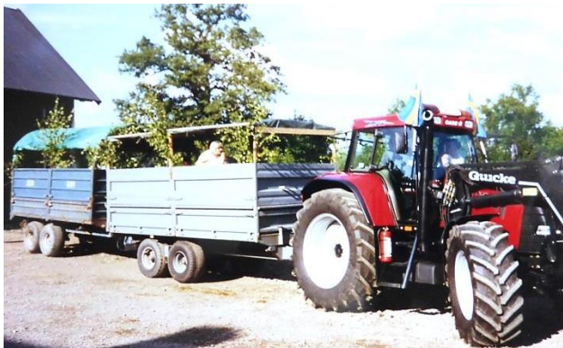
Gästerna anlände med traktorer och vagnar till grisfesterna i Giltebo. HBF nr 2857.