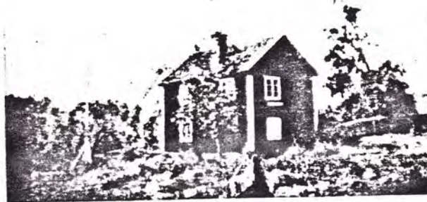
Klockarebyggnaden — skolhuset — fattighuset

Det var tydligen hårda tider och vi stannar i vördnad inför fädernas kamp. Så utgår vår stormaktstid i nödens och svältens tecken.