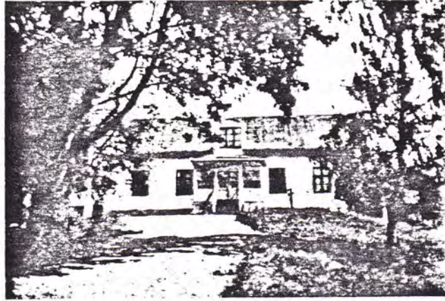
Fredriksberg — den nuvarande skolan byggd 1871

kartor över fäderneslandet böra anskaffas, i vilket yrkande biskopen instämde.