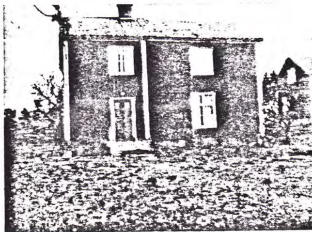
Hellingsfalls skola 1845—1932 — Hannäs första skolhusbygge