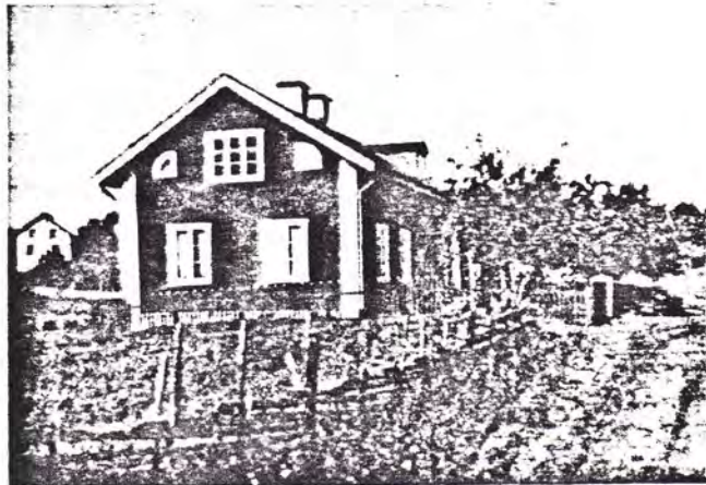
Dagsbergs gamla skola — nu ombyggd till bostad