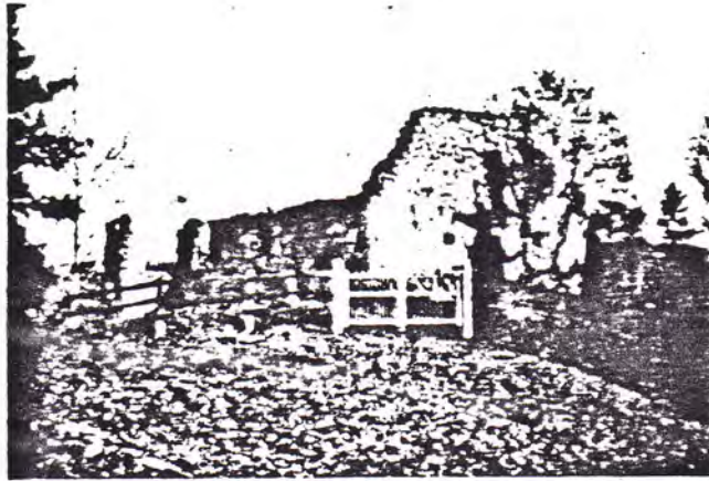
Resterna av Hannäs 1200-talskyrka