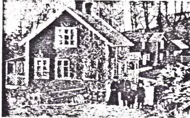
Hannäs prästgård vid sekelskiftet, strax till höger låg sockenhuset