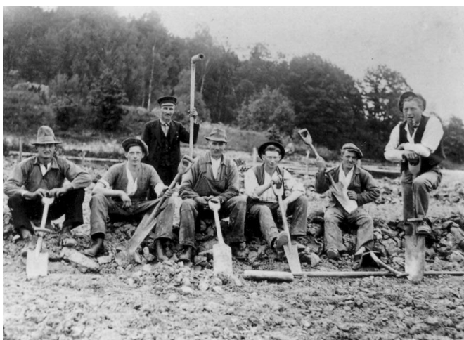
Täckdikesgrävning vid Bredal 1931

Mangårdsbyggnaden är uppförd 1876 och ekonomibyggnaderna omkring 1900. 1939 byggdes det mindre bostadshuset och statbyggnaden.