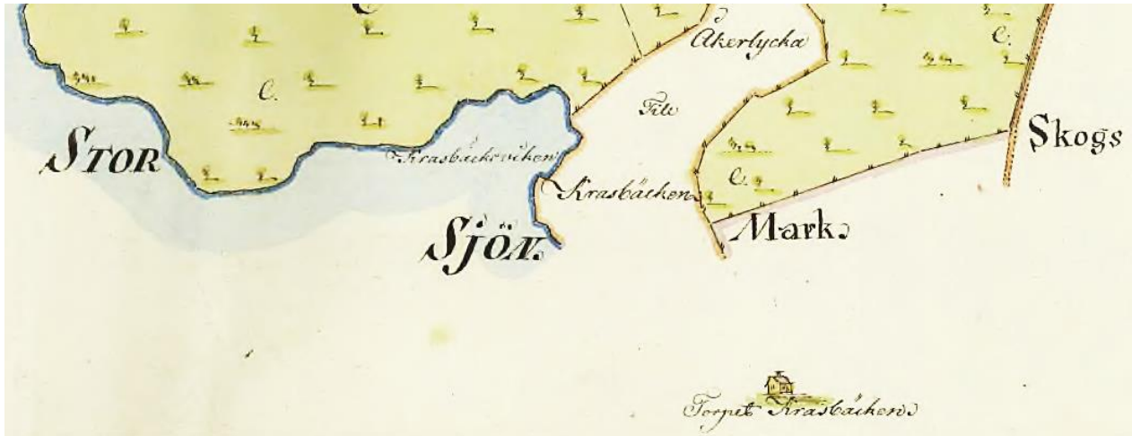
Karta upprättad 1799 vid Storskiftet