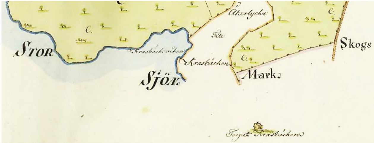
Karta upprättad 1799 vid Storskiftet