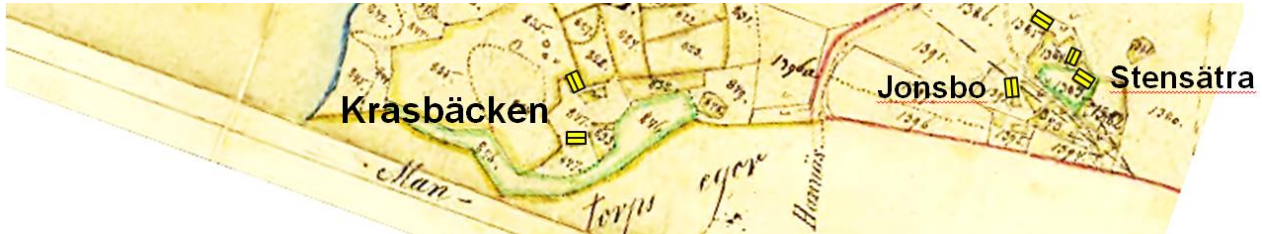
Karta ritad 1864 till Laga skifte (1870)