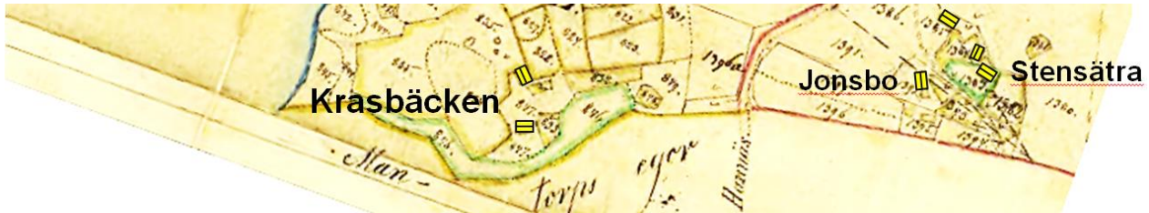
Karta ritad 1864 till Laga skifte (1870)