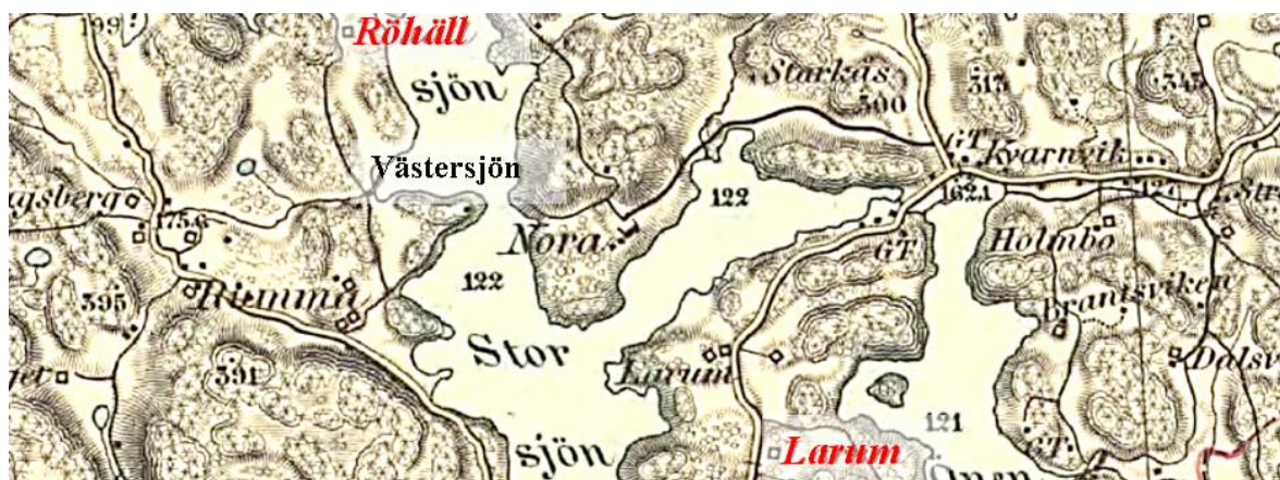
Generalstabens karta 1881

Torpskylt är uppsatt och koordinater tagna på husgrunden av den gamla torpstugan.