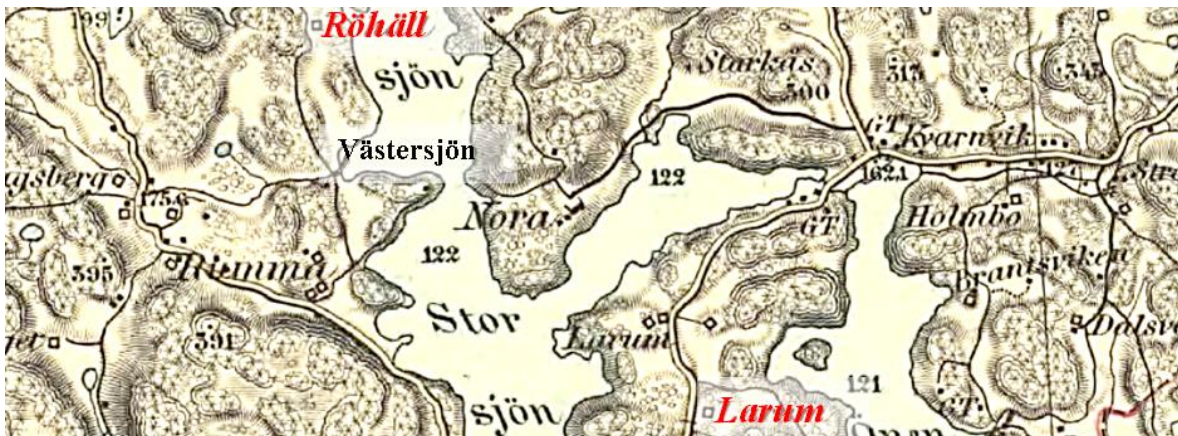
Generalstabens karta 1881

Torpskylt är uppsatt och koordinater tagna på husgrunden av den gamla torpstugan.