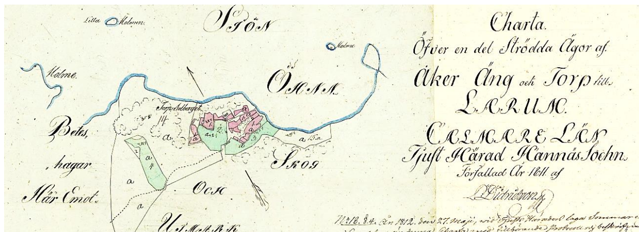
Karta upprättad 1812 vid Hemmansklyvning