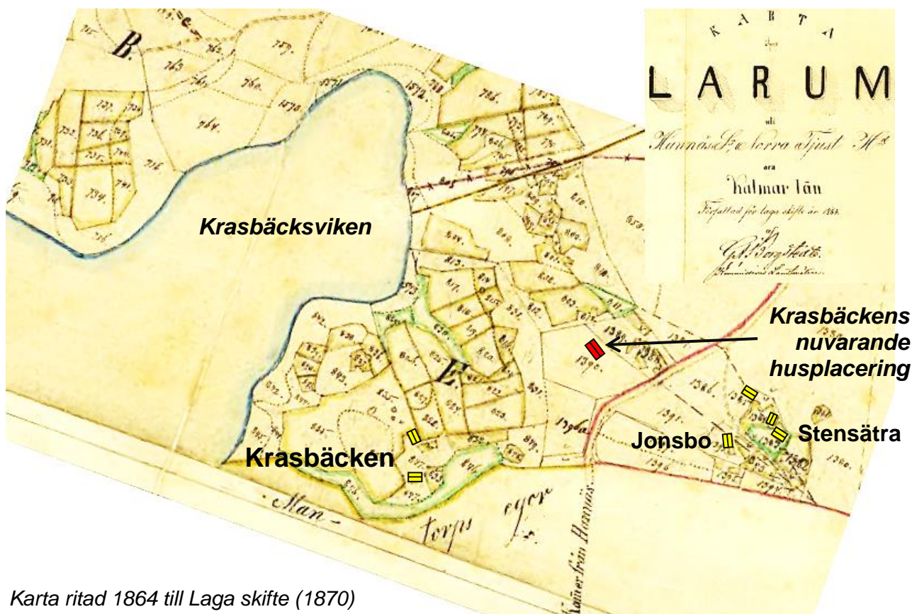
Karta ritad 1864 till Laga skifte (1870)