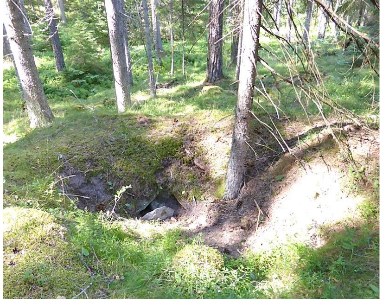
Förvaringsgrop eller källare 2022.

Förvaringsgrop koordinater: N58°10,939' E16°26,056'