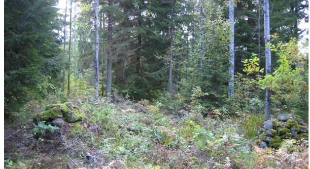
Odlingsrösen ? 2005

Björkkärr finns under Knappemåla i Husförhörslängden 1814, men tomt 1815. Nu ligger Björkkärr under Skrickerum 1:16 i Tryserums socken.