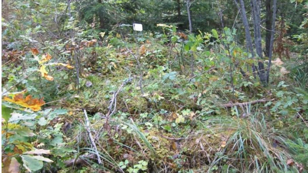
Björkkärr husgrund med spisröse 2005