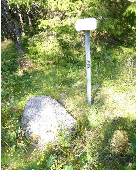
Ny torpskylt sattes upp 2022.