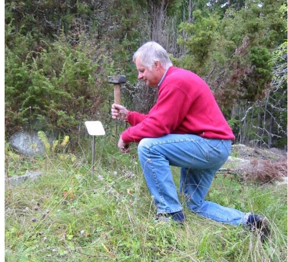
Uppsättning av torpskylt 2005

Källsveden tillkom i Husförhörslängden 1845, var tomt 1909, och borta 1917.