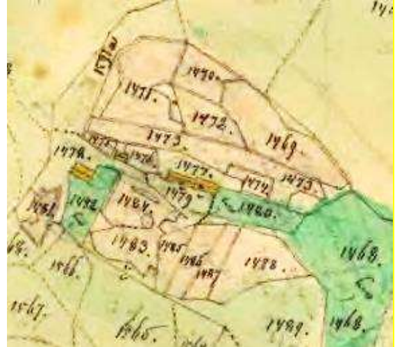
Laga skifte 1864.

När Tristad tillkom är okänt. Tristad finns i handlingarna till Storskiftet och är även inritat på storskifteskartan 1795. Tristad tillhörde Skattegården, men marken, åbyggnaderna och gårdesgårdarna tillföll Frälsegården vid Laga skifte 1867: