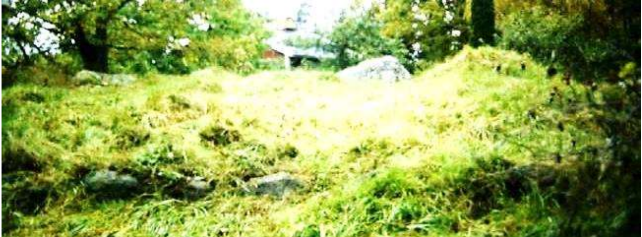
Lilla Nystad. GE 2015.

När Lilla Nystad tillkom är okänt. Lilla Nystad finns inte nämnt i handlingarna i samband med Storskiftet 1775-95.