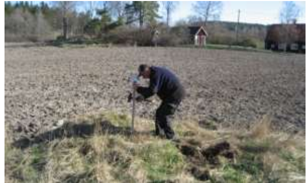
Uppsättning av torpskylt på husgrunden. SP 2017.

Byggnadsåret för Kuskbostaden är okänt, och det framgår inte i HFL när eller av vem den var bebodd. I HFL finns ingen kusk på Hägerstad Frälse, endast på Skatte.