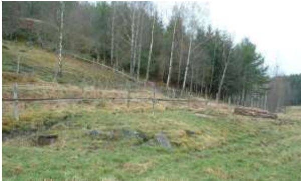
Kuskbostaden husgrund. GE 2015.