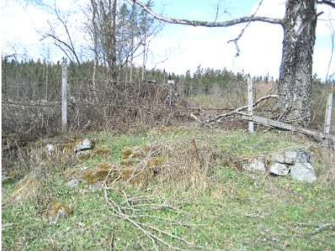
Husgrunden med spisröse. SP 2017.