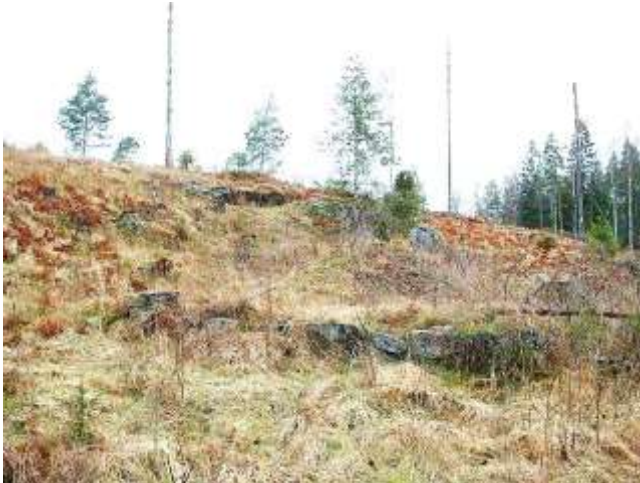
Husgrunden. GE 2015.