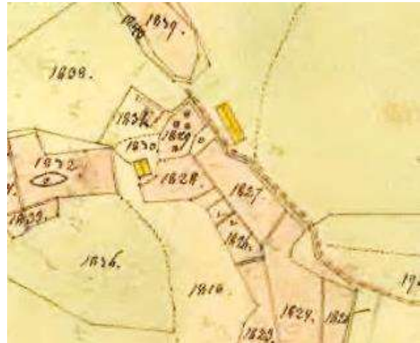
Laga skifte 1864.

Neustadt Donationshem tillkom i HFL 1860, och 1875 benämns det Neustad. Stugan var grå och omålad, och bestod av kök, rum, kammare och farstu, samt en kammare uppå.