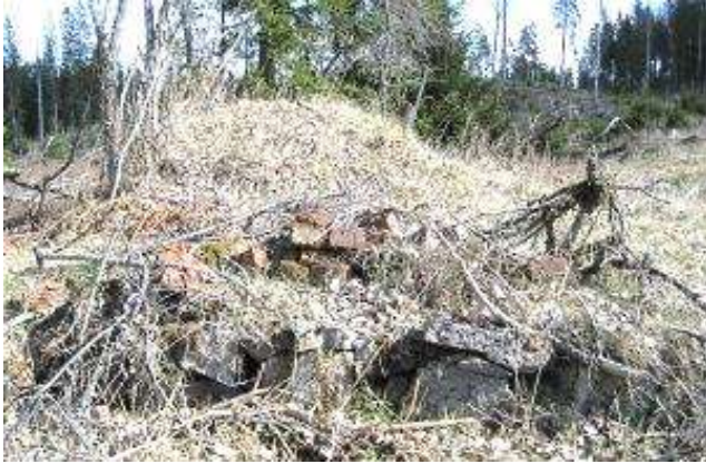
Spisorset på husgrunden. SP 2017.