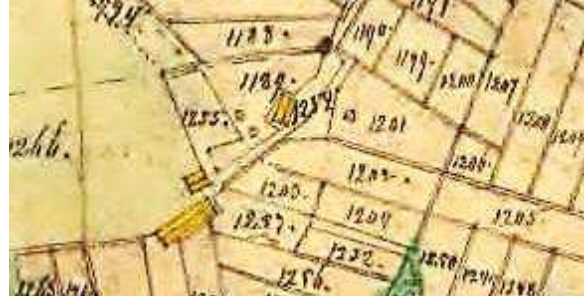
Laga skifte 1864.

Abrahamsdal tillkom i HFL 1821. Huset var i två våningar med två lägenheter.