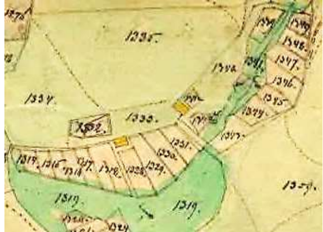
Laga skifte 1864.

Godttorp (Lycktorp) tillkom i HFL 1847 och var tomt i HFL från 1866. Godttorp var endast bebott under nitton år!