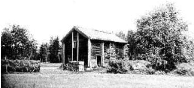
Abrahamsdal 1940-tal. HBF nr 890.