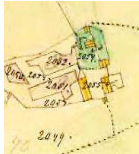
Laga skifte 1864

Johannesberg tillkom i HFL 1833, men 1835 heter det Johannesberg. Från 1880 är torpet även benämnt Bygget. Sedan varierar namnet; Johannisborg, Johannisberg, Johannesberg och Bygget.