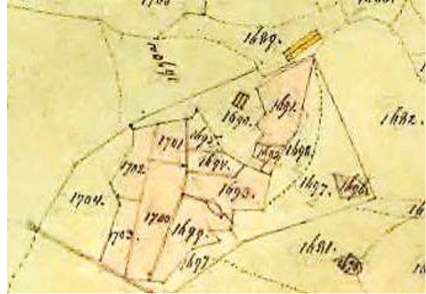
Laga skifte 1864.

När Brunstad tillkom är okänt. Torpet finns inte nämnt i handlingarna i samband med Storskiftet 1775-95. Brunstad tillhörde Skattegården, men marken, åbyggnaderna och gärdesgårdarna tillföll Frälsegården vid Laga skifte 1867: