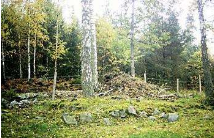
Husgrund med spisröse. GE 2015.