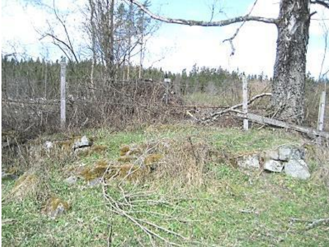
Husgrunden med spisiröse. SP 2017.