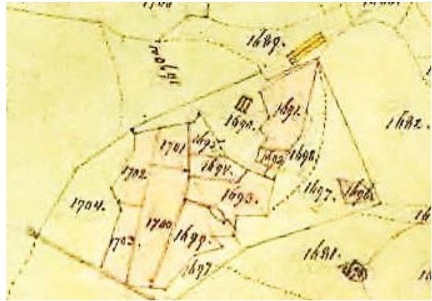
Laga skifte 1864.

När Brunstad tillkom är okänt. Torpet finns inte nämnt i handlingarna i samband med Storskiftet 1775-95. Brunstad tillhörde Skattegården, men marken, åbyggnaderna och gärdesgårdarna tillföll Fräsegården vid Laga skifte 1867: