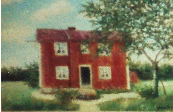
Fredrikslund avmålat på Engdahls tid. HBF nr 2817.