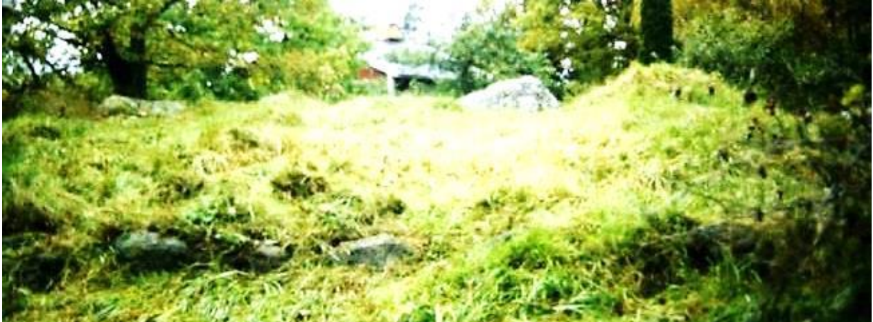
Lilla Nystad. GE 2015.

När Lilla Nystad tillkom är okänt. Lilla Nystad finns inte nämnt i handlingarna i samband med Storskiftet 1775-95.