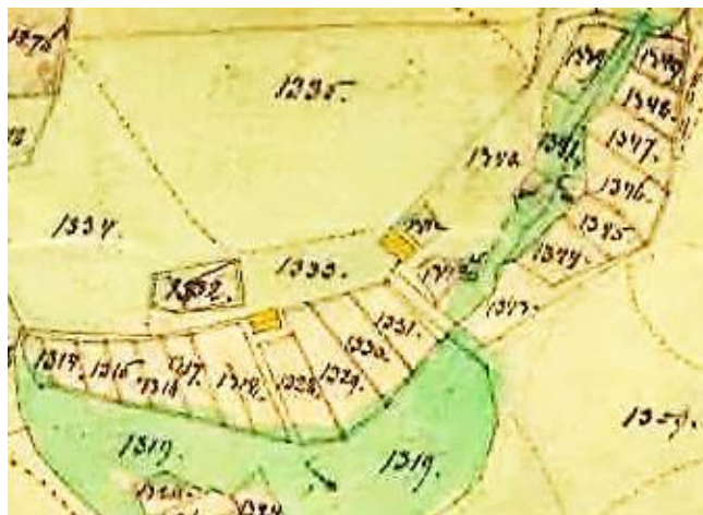
Laga skifte 1864.

Godttorp (Lycktorp) tillkom i Husförhörslängden 1847 och var tomt i Husförhörslängden från 1866. Godttorp var endast bebott under nitton år!