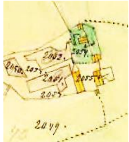
Laga skifte 1864

Johannesberg tillkom i Husförhörslängden 1833, men 1835 heter det Johannesborg. Från 1880 är torpet även benämnt Bygget. Sedan varierar namnet; Johannisborg, Johannisberg, Johannesberg och Bygget.