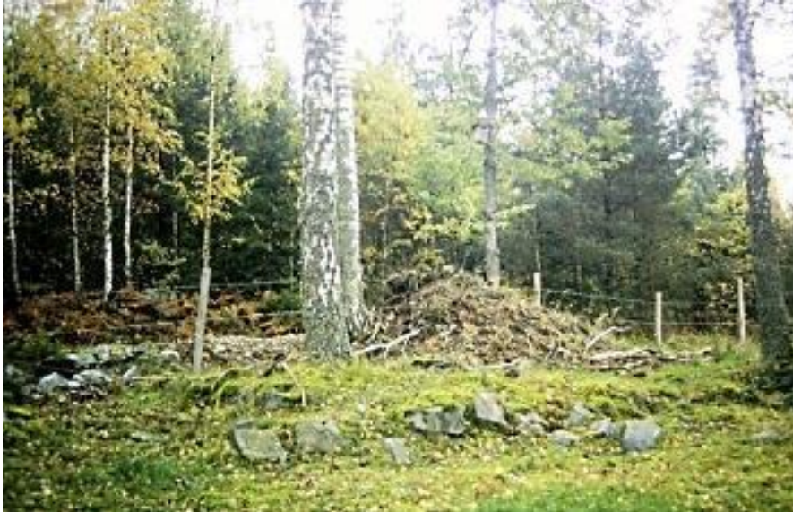
Husgrund med spiseröse. GE 2015.