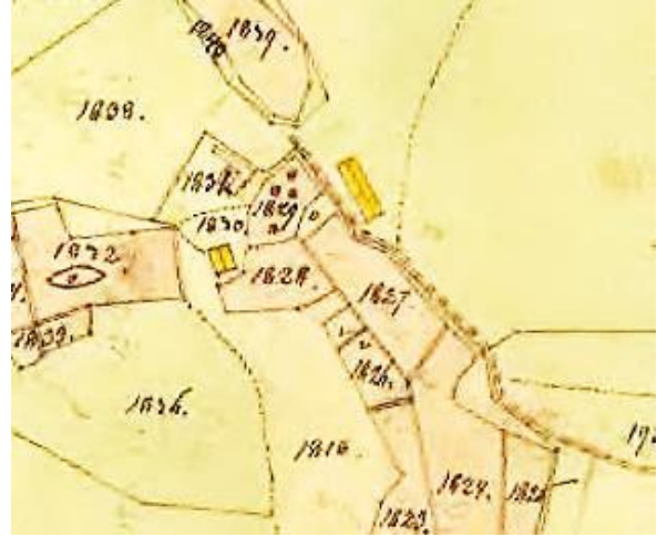
Laga skifte 1864.

Neustadt Donationshem tillkom i Husförhörlängden 1860, och 1875 benämns det Neustad. Stugan var grå och omålad, och bestod av kök, rum, kammare och farstu, samt en kammare uppå.