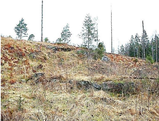
Husgrunden. GE 2015.