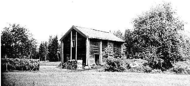
Abrahamsdal 1940-tal. HBF nr 890.