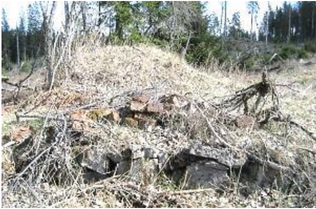
Spiseröset på husgrunden. SP 2017.