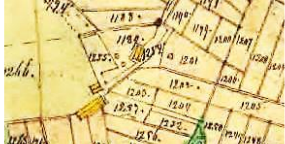
Laga skifte 1864.

Abrahamsdal tillkom i Husförhörslängden 1821. Huset var i två våningar med två lägenheter.