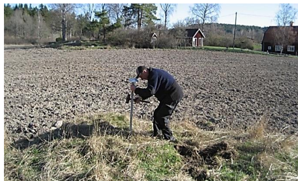
Uppsättning av torpskylt på husgrunden. SP 2017.

Byggnadsåret för Kuskbostaden är okänt, och det framgår inte i Husförhörslängden när eller av vem den var bebodd. I Husförhörslängden finns ingen kusk på Hägerstad Frälse, endast på Skatte.