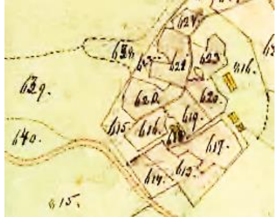
Laga skifte 1864.