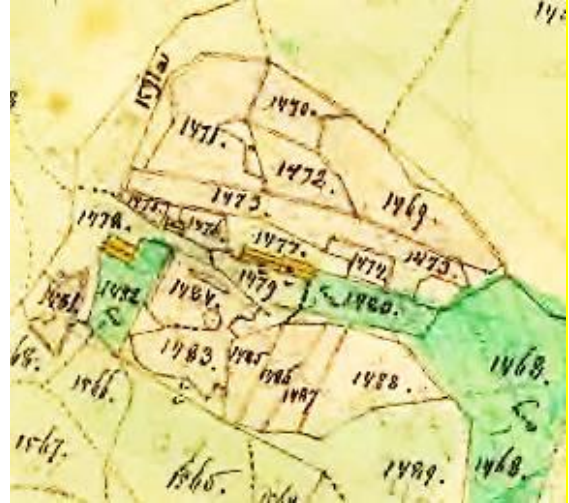
Laga skifte 1864.

När Tristad tillkom är okänt. Tristad finns i handlingarna till Storskiftet och är även inritat på storskifteskartan 1795. Tristad tillhörde Skattegården, men marken, åbyggnaderna och gårdesgårdarna tillföll Frälsegården vid Laga skifte 1867: