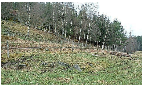
Kuskbostaden husgrund. GE 2015.