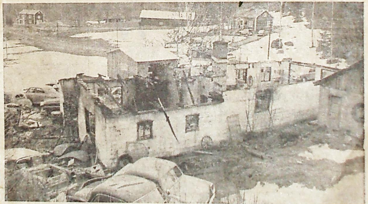
Verkstaden blev som synes helt urblåst.