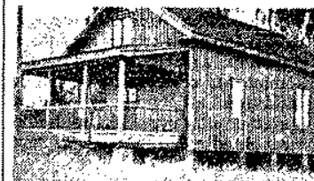
Skyttepaviljongen är byggd av en gammal tomstuga.

i Hannäs som också har en livaktig verksamhet. Följande medlemssiffror säga en hel del: skytteföreningen 100, idrottsföreningen 104, lottakåren 50, SLU 110, BF 90 och SLKF 60. Förutom dessa finnes bl. a. SLS-avd., kyrklig ungdomsförening, RLF-avd., arbetarekommun och hemvärd.