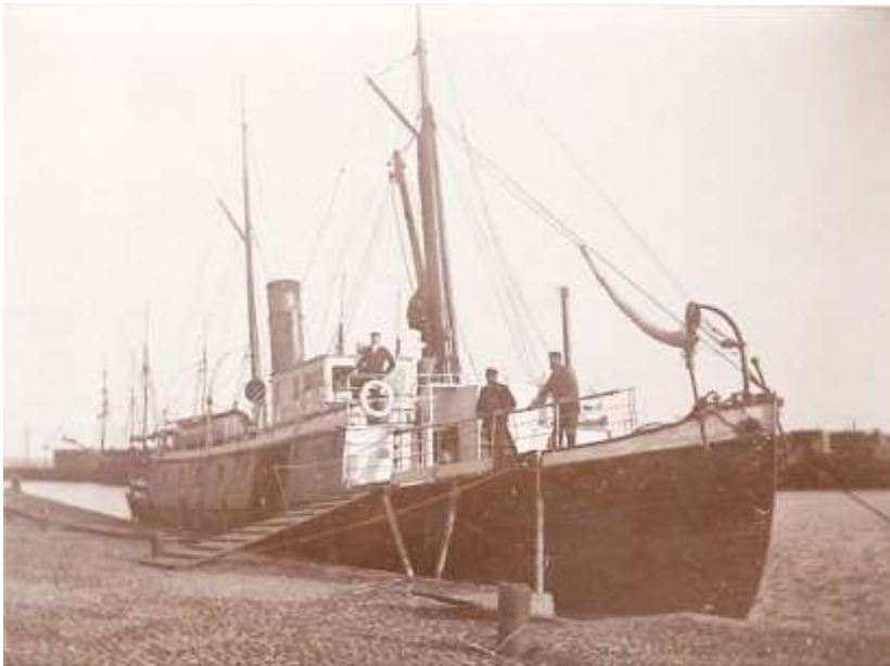
Ångfartyg Kalmarsund No 6.