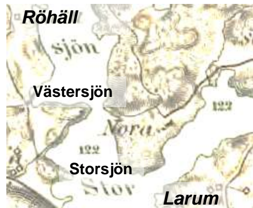
Generalstabens karta 1881

Under februari 1899 anställdes 20 vana timmerhuggare med löfte om god arbetsförtjänst. Arbetsstyrkan sysselsattes med avverkning på Röhällsskogen. Timret transporterades sjövägen via Västersjön och Storsjön till Larum. Detta var innan sjöarna sänktes två meter, och det fanns heller inte någon bro över sundet mellan sjöarna. Timret kunde vid den tiden antingen flottas eller köras på isen hela vägen.