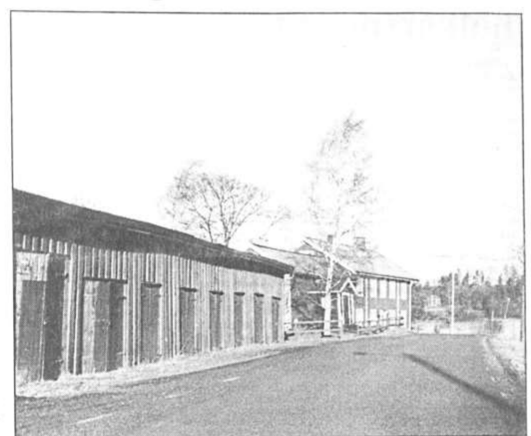
De gamla kyrkstallarna alldeles intill vägen har fått stå kvar.