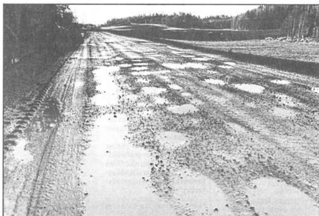
Full av potthål är vägen mellan kyrkbyn och Kvarnvik. Men i höst skall vägen få beläggning om allt går enligt planerna.