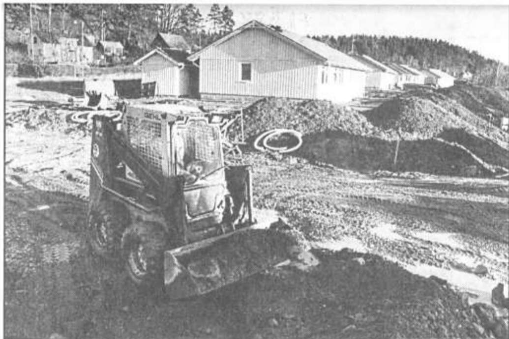
I Kvarnvik byggs det för fulla muggar. Den senaste tiden har 8 lägenheter färdigställts vid Larumsvägen. Men fler står på programmet.