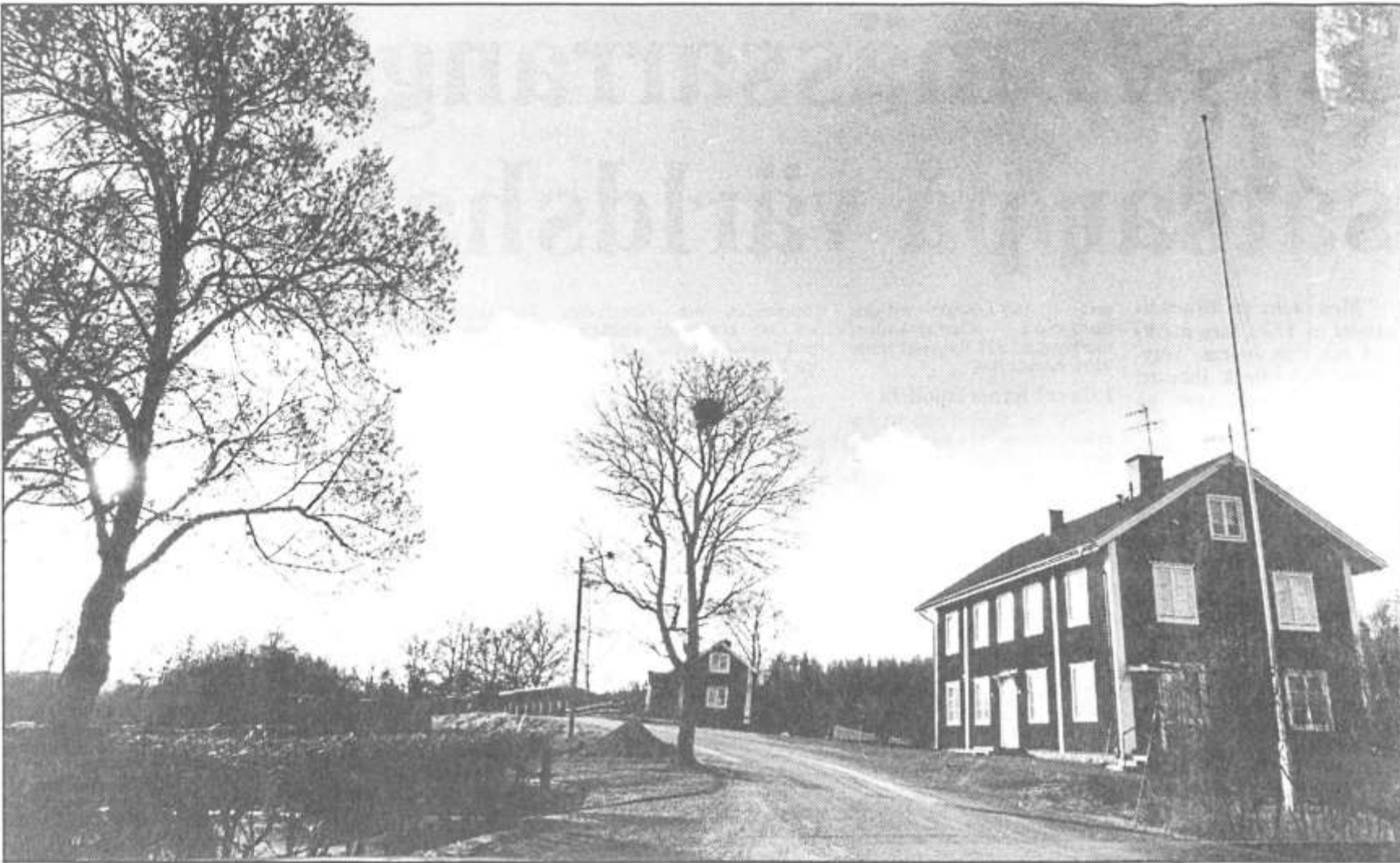
Hannäs är en liten socken som alltid fått hävda sig och där devisen Hela Sverige skall leva hyllades långt innan den riksomfattande glesbygdskampanjen påbörjades för ett par år sedan.